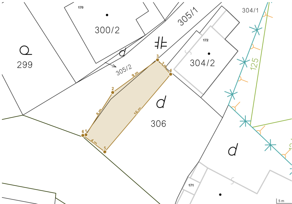
Parkovisko č. 3 pri obecnom úrade